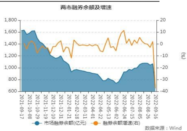
图表3：两市融券余额及增速