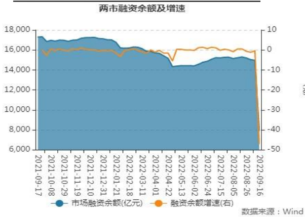
图表2：两市融资余额及增速