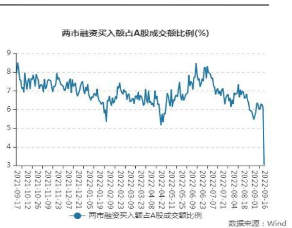
图表5：两市融资买入股占A股成交额比例 (%)