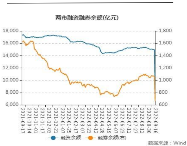
图表4：两市融资融券余额